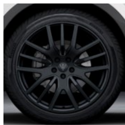
ANTEO black+ Jante en alliage léger de 21" Pirelli WINTER SOTTOZERO™ 3 incl.