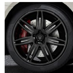
MERCURIO black&white Jante en alliage léger de 20" Pirelli WINTER SOTTOZERO™ 3 incl.

avant: 245 / 40 ZR20 arrière: 285 / 35 ZR20