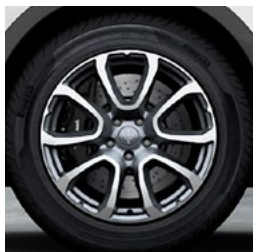
ZEFIRO Jante en alliage léger de 19" Pirelli WINTER SOTTOZERO™ 3 incl.