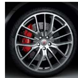
TITANO Jante en alliage léger de 21" Pirelli WINTER SOTTOZERO™ 3 incl.

avant: 245 / 35 ZR21 arrière: 285 / 30 ZR21