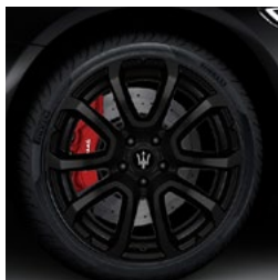
ZEFIRO matt black+ Jante en alliage léger de 19" Pirelli WINTER SOTTOZERO™ 3 incl.