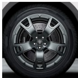
NEREO glossy grey+ Jante en alliage léger de 20" Pirelli WINTER SOTTOZERO™ 3 incl.