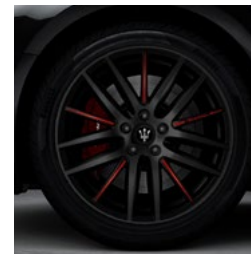
PROTEO nero rosso Jante en alliage léger de 19" Pirelli WINTER SOTTOZERO™ 3 incl. avant: 245/45 ZR19 arrière: 275/40 ZR19