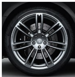
URANO Jante en alliage léger de 20" Pirelli WINTER SOTTOZERO™ 3 incl. avant: 245/40 ZR20 arrière: 285/35 ZR20