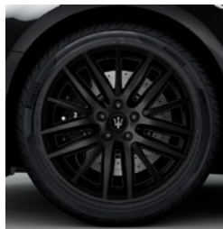
PROTEO nero Jante en alliage léger de 19" Pirelli WINTER SOTTOZERO™ 3 incl. avant: 245/45 ZR19 arrière: 275/40 ZR19