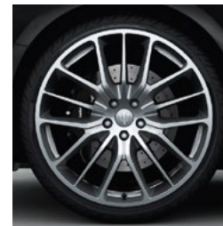
TITANO matt Jante en alliage léger de 21" Pirelli WINTER SOTTOZERO™ 3 incl. avant: 245/35 ZR21 arrière: 285/30 ZR21