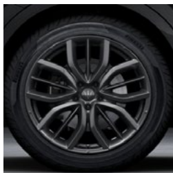
EFESTO myron+ Jante en alliage léger de 20" Pirelli WINTER SOTTOZERO™ 3 incl.