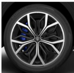
ERACLE+ Jante en alliage léger de 21" Pirelli WINTER SOTTOZERO™ 3 incl.