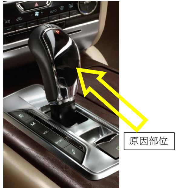
トランスミッションのギア位置の表示部位