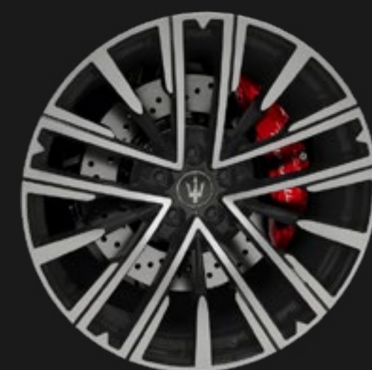
PEGASO 21" MATTE MIRON