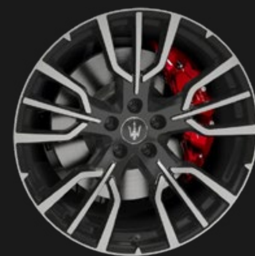
ETERE 20" MATTE GREY