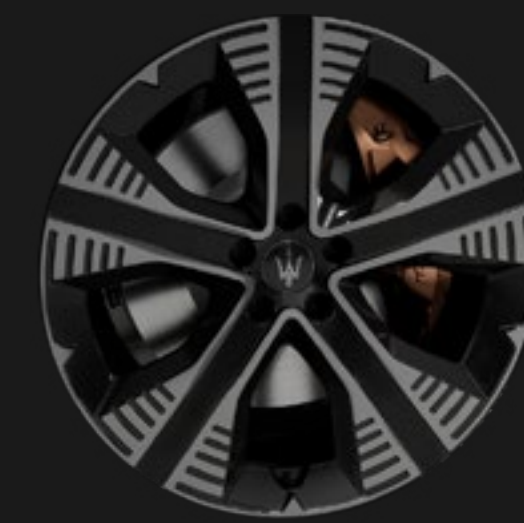
NEMBO 20" MATTE BLACK