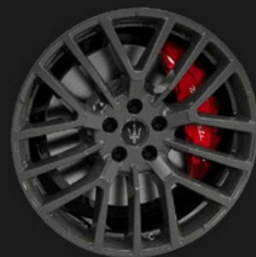
THETIS 19" GLOSSY BLACK

Chaque roue du Grecale est un pur chef-d'œuvre en soi : parfaitement équilibrée, concentrée en technologies de pointe et résolument stylée.