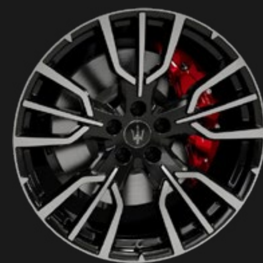
ETERE 20" GLOSSY BLACK DIAMOND CUT