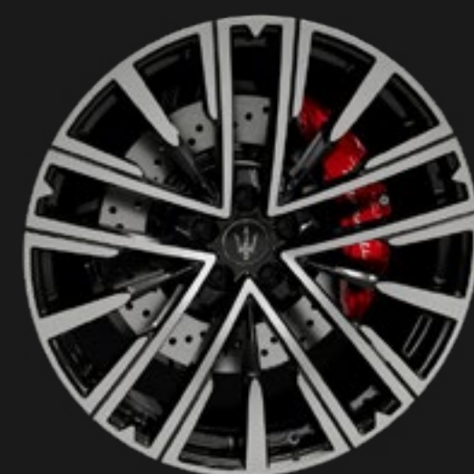
PEGASO 21" GLOSSY BLACK