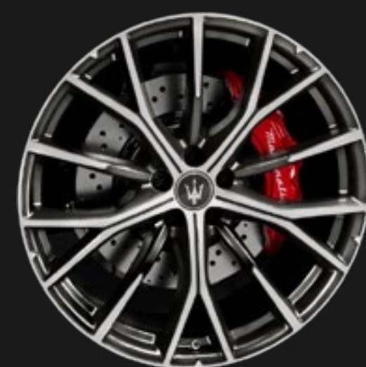
CRIO 21" GLOSSY MIRON