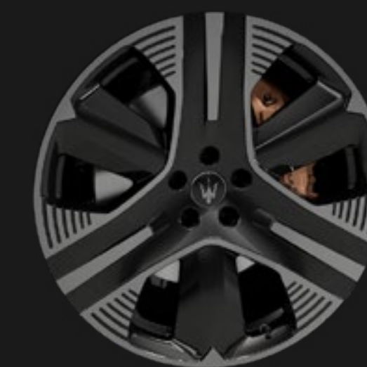
LAMPO 21" GLOSSY BLACK