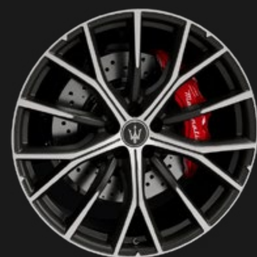
CRIO 21" MATTE ALUMINUM