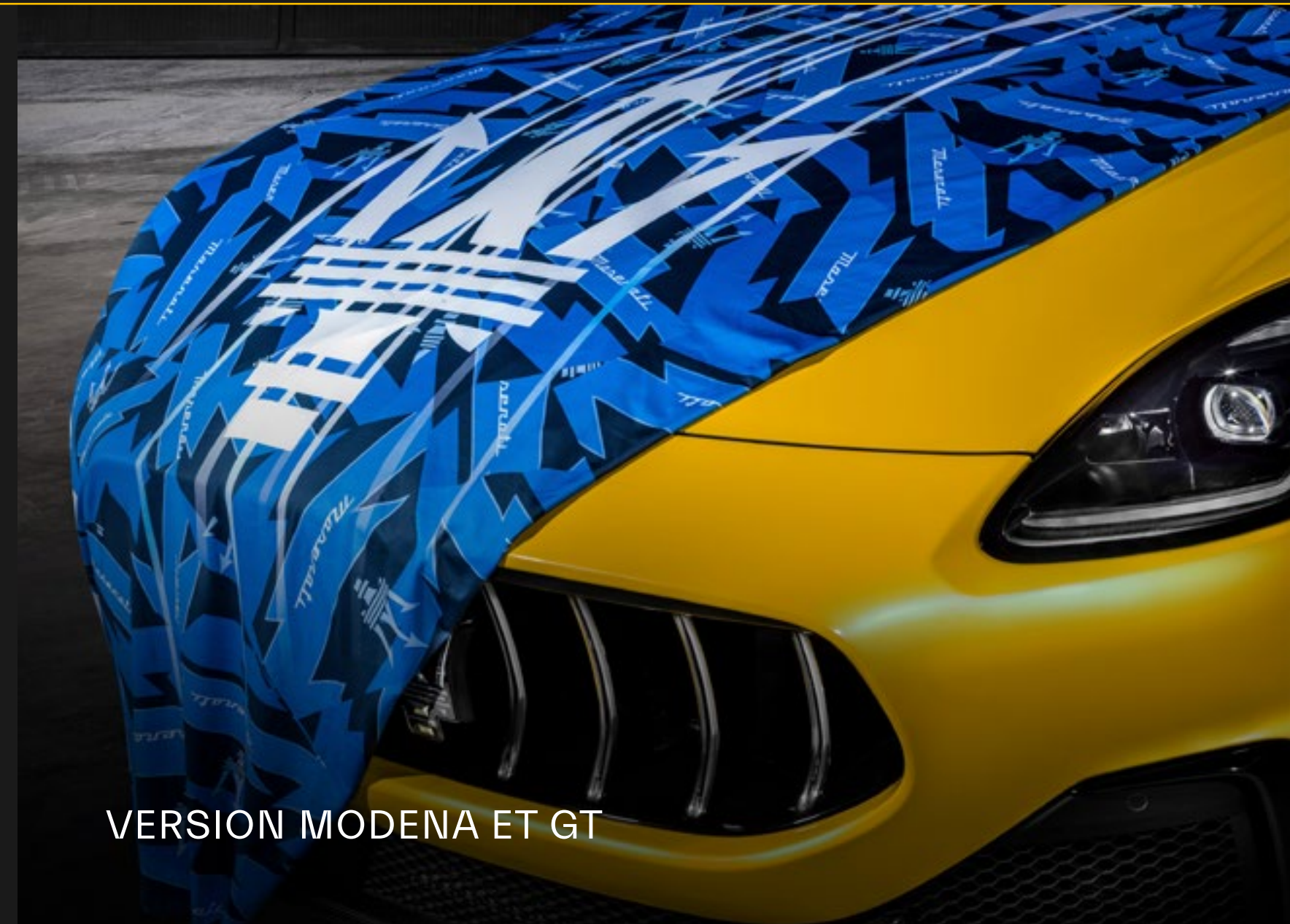
VERSION MODENA ET GT