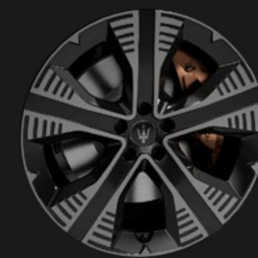
NEMBO 20" GLOSSY BLACK