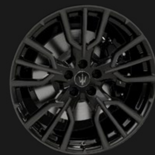
ETERE 20" GLOSSY BLACK