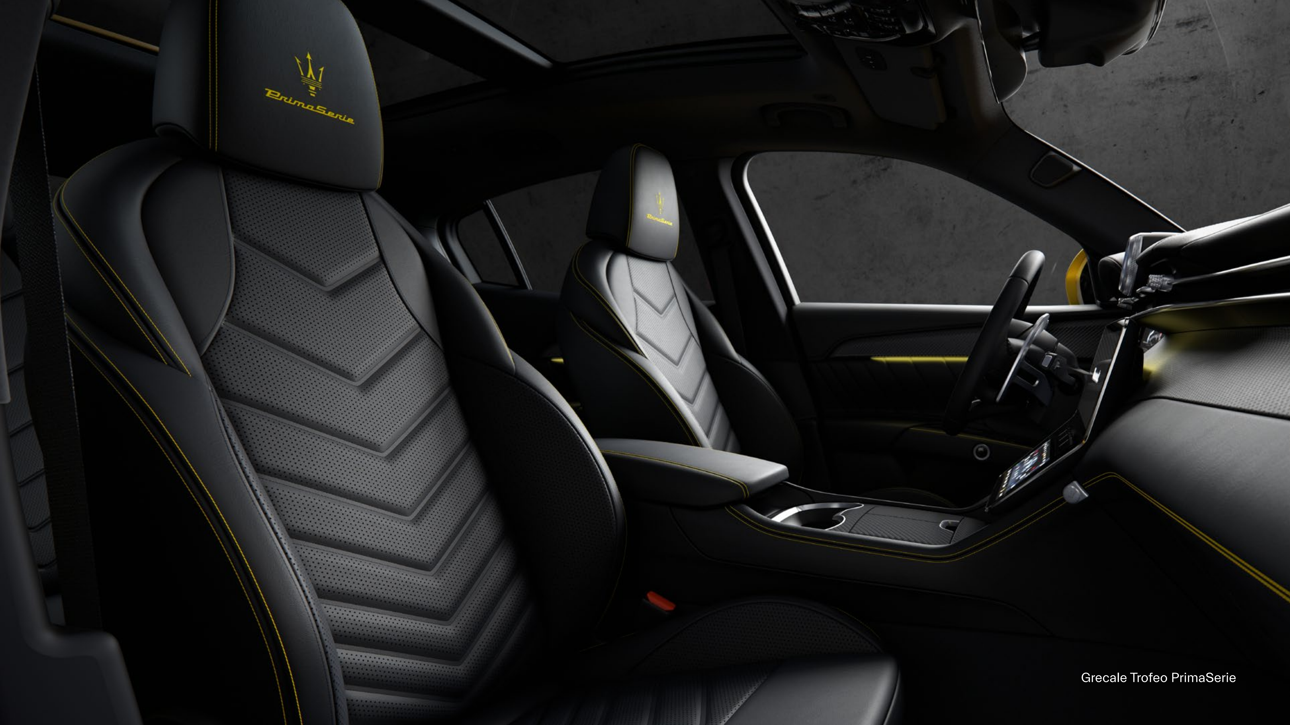
Grecale Trofeo PrimaSerie