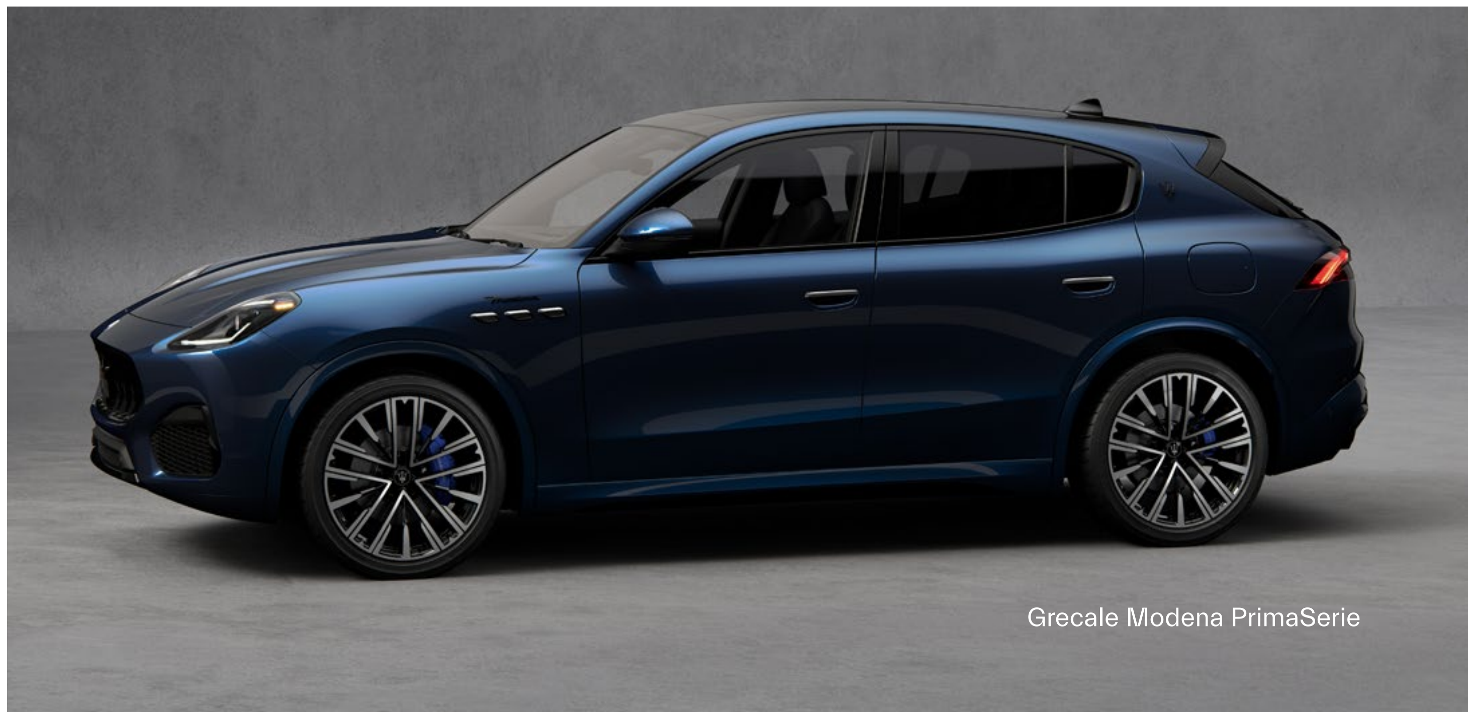
Grecale Modena PrimoSerie