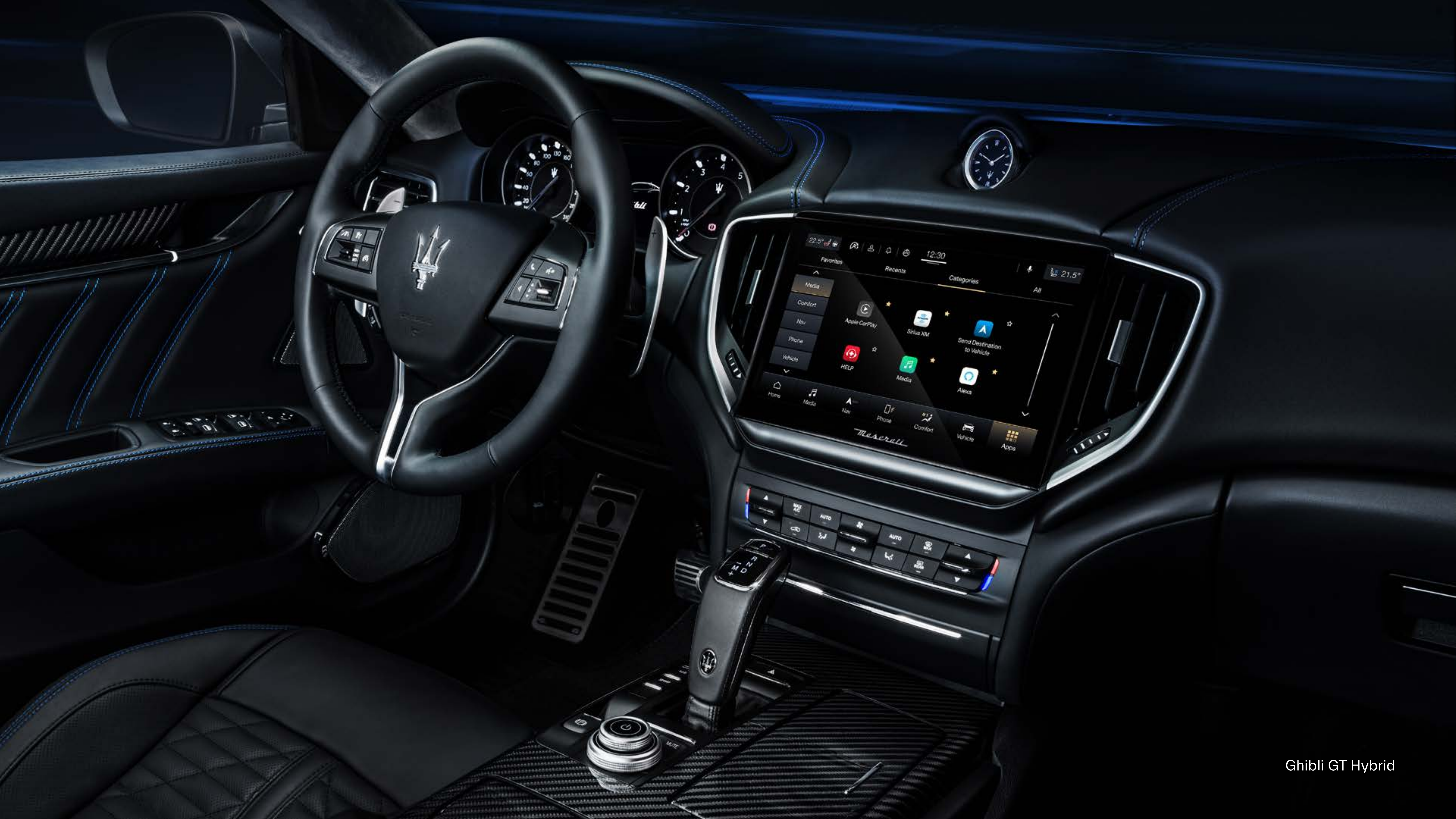
Ghibli GT Hybrid