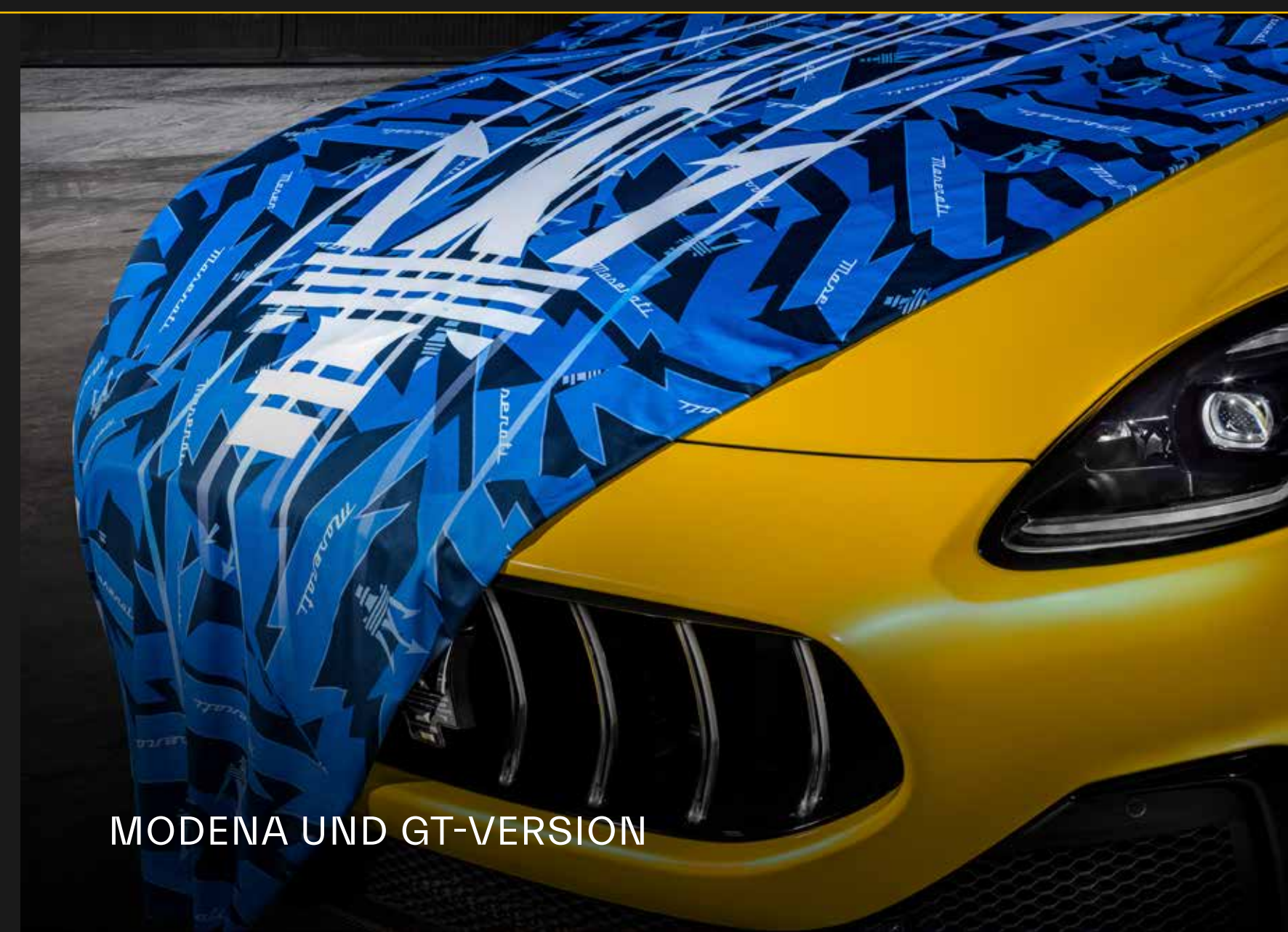
MODENA UND GT-VERSION