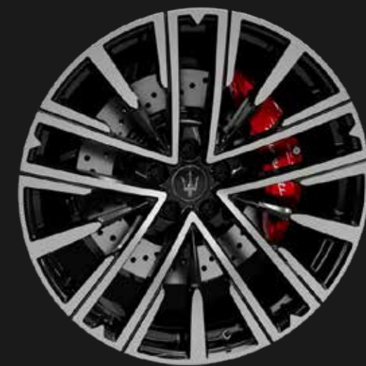
PEGASO 21" GLOSSY BLACK