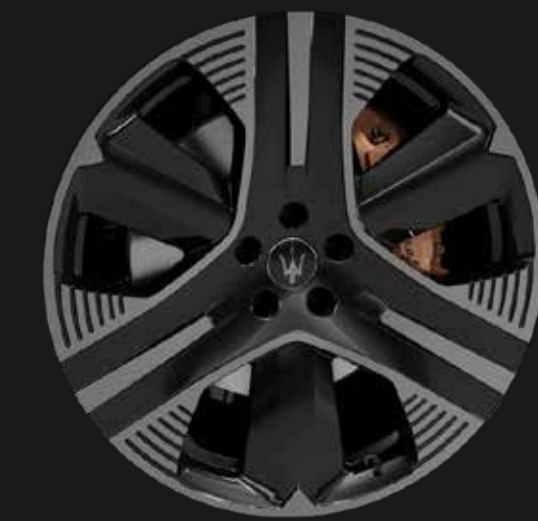
LAMPO 21" GLOSSY BLACK