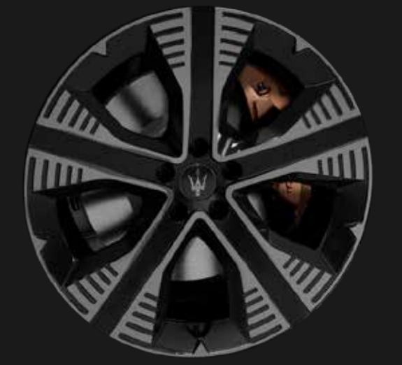
NEMBO 20" MATTE BLACK