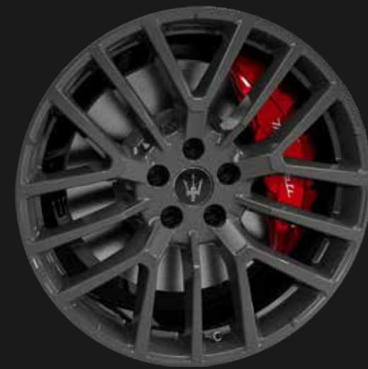
THETIS 19" GLOSSY BLACK

Jedes Rad des Grecale ist ein kleines Meisterwerk – perfekt ausgewogen, technisch überlegen und äußerst stilvoll.