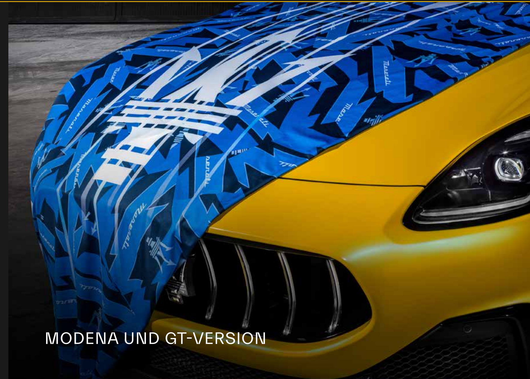
MODENA UND GT-VERSION