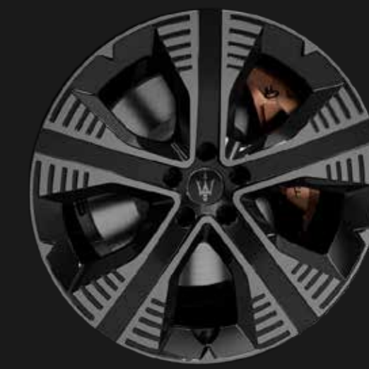
NEMBO 20" GLOSSY BLACK