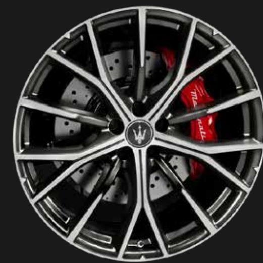
CRIO 21" GLOSSY MIRON