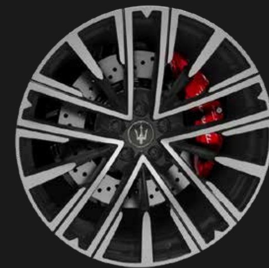
PEGASO 21" MATTE MIRON