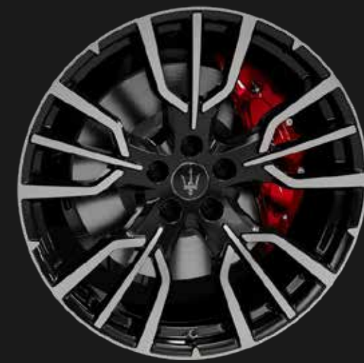
ETERE 20" GLOSSY BLACK DIAMOND CUT