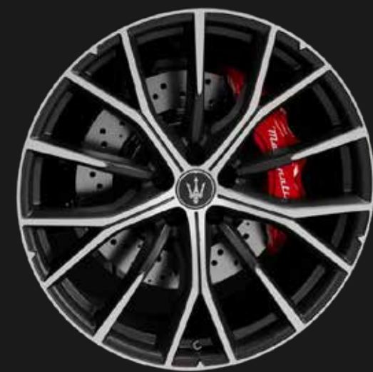
CRIO 21" MATTE ALUMINUM