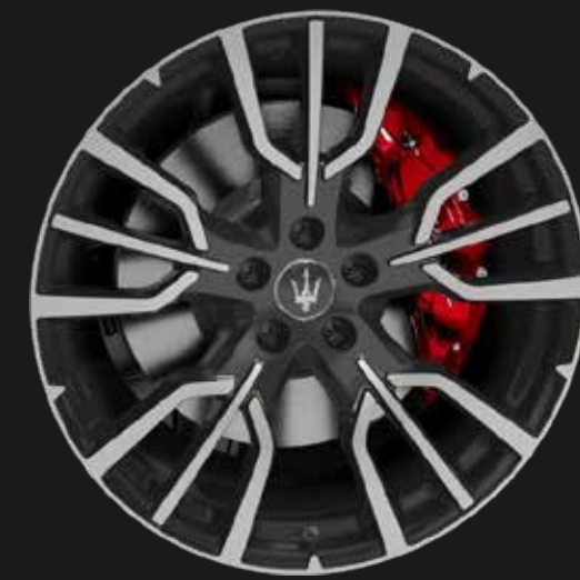
ETERE 20" MATTE GREY