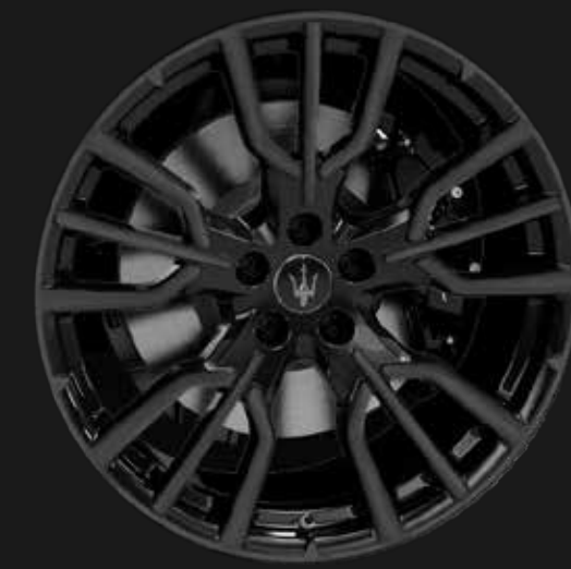
ETERE 20" GLOSSY BLACK