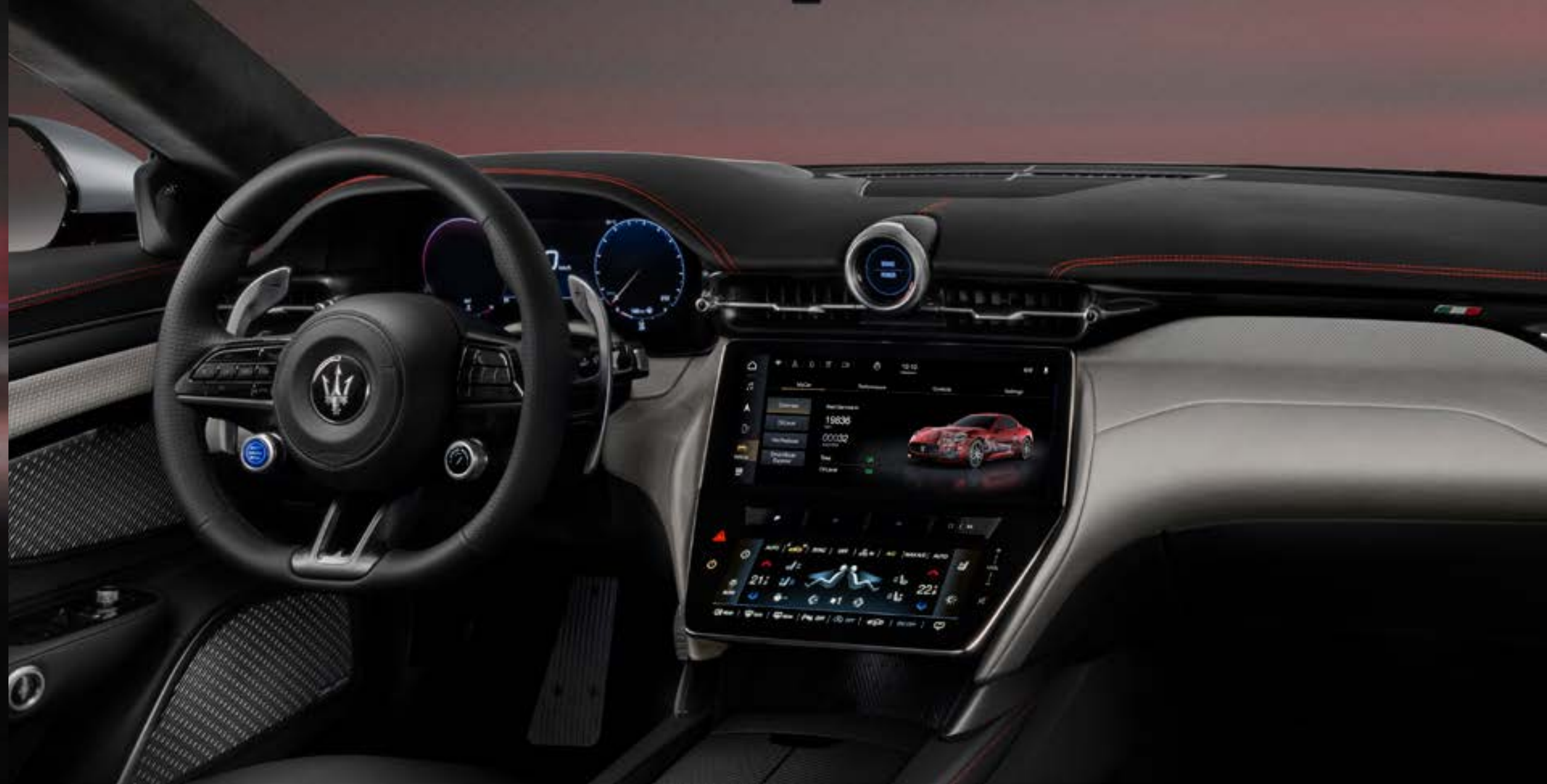
Trofeo - Grigio Lamiera