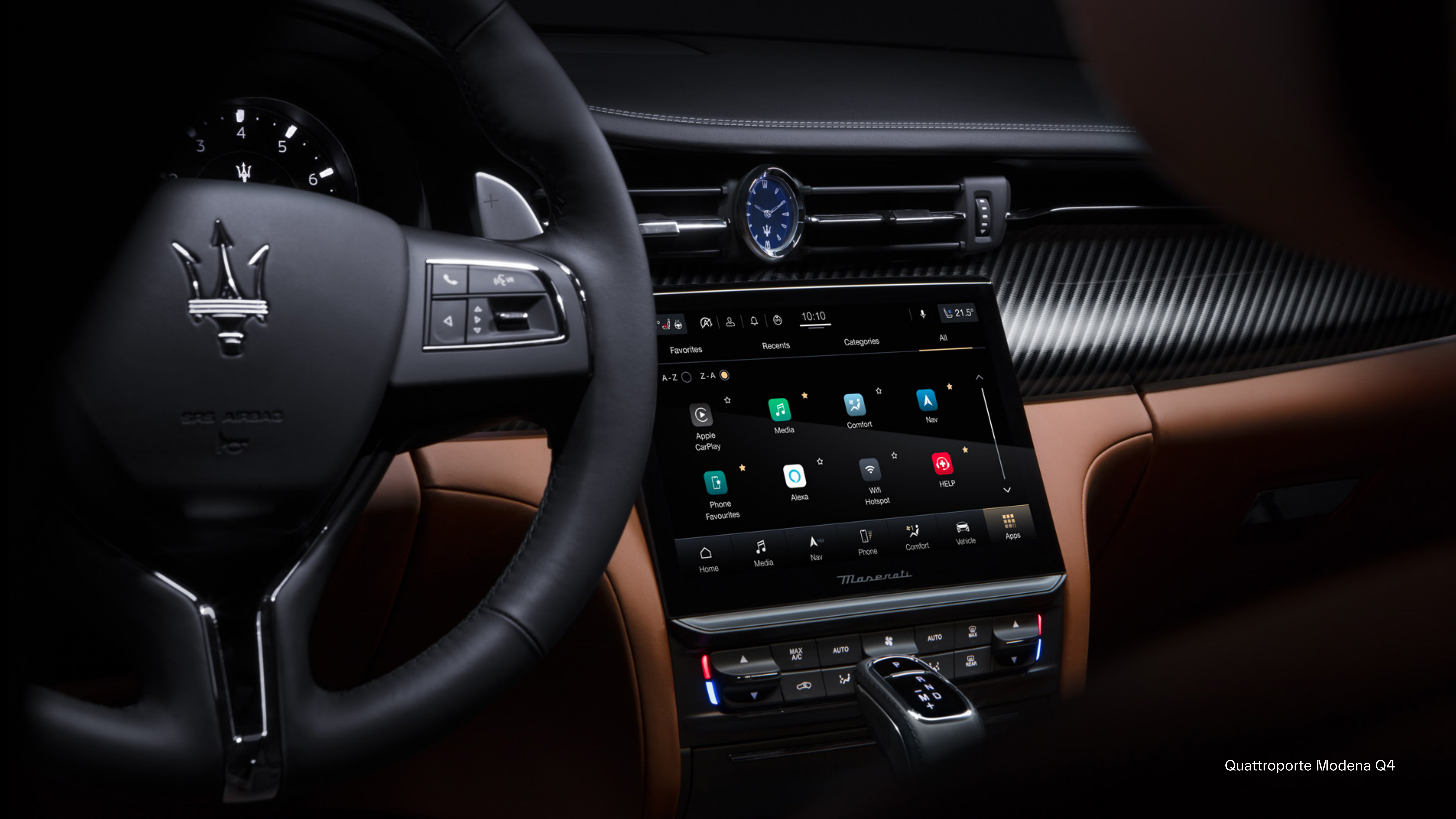
Quattroporte Modena Q4